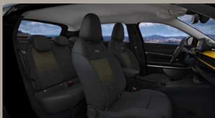
Sedadla čalouněná v kombinaci látky Robin a vinylu se žlutým podkresem (Summit 2ZL)