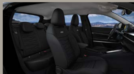
Sedadla čalouněná syntetickou kůží (Altitude a Summit 1AL)